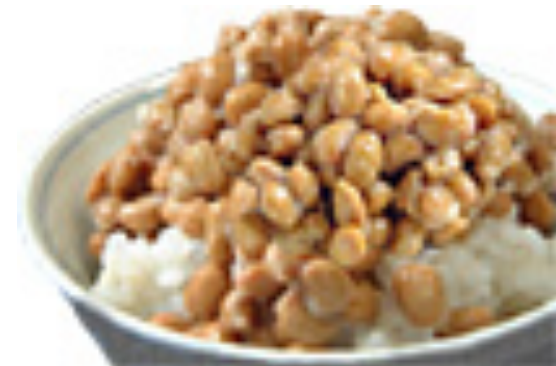
煮た大豆を納豆菌で発酵させたもの