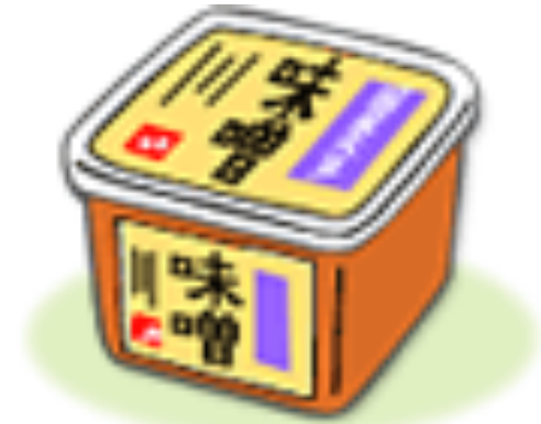
蒸して煮た大豆と米や大麦を麹菌（こうじきん）で発酵させたもの