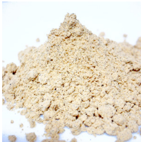
煎った大豆を粉にしたもの