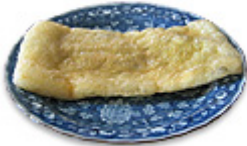
木綿豆腐を薄く切って水分を取り、油で揚げたもの