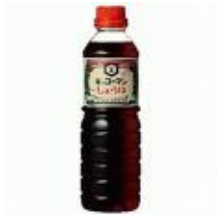
脱脂大豆などを麹菌（こうじきん）で発酵させたもの