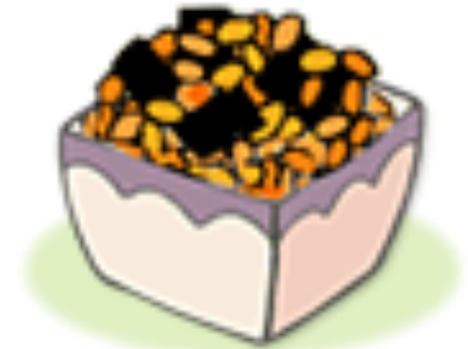
大豆を煮込んだ料理