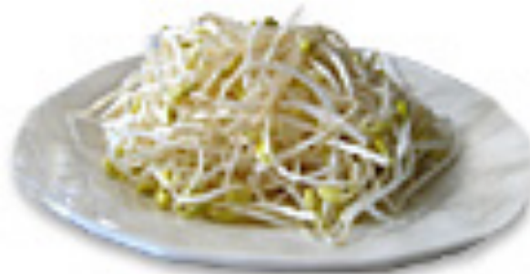
大豆を暗い所で発芽させたもの